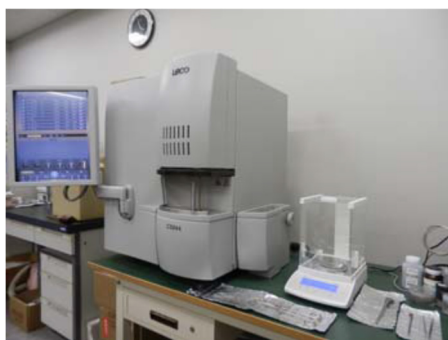
炭素・硫黄分析装置