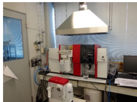
原子吸光分析装置