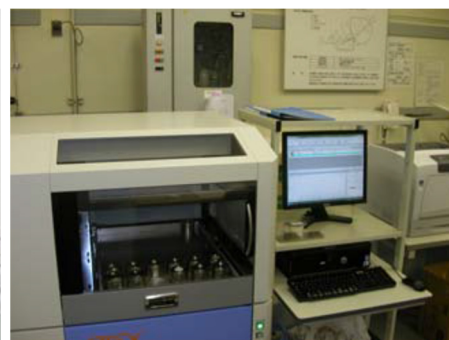
波長分散型蛍光 X 線分析装置