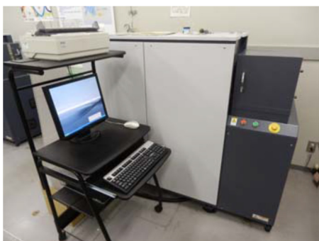
スパーク放電発光分析装置