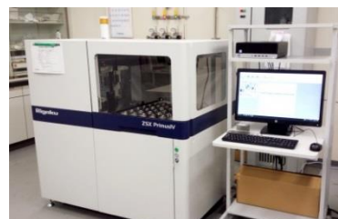
波長分散型蛍光 X 線分析装置

異物・混入物の素性はさまざまであり、特定の分析法だけで対応できることはまれです。講義1では、金属などの非破壊元素分析に優れた蛍光X線分析装置による異物分析について、分析データの正しい活用法などさまざまな事例を交えて解説します。