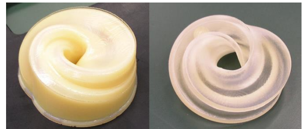
造形直後 サポート材除去後