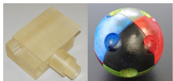
可動ステージ 球体 (染色)