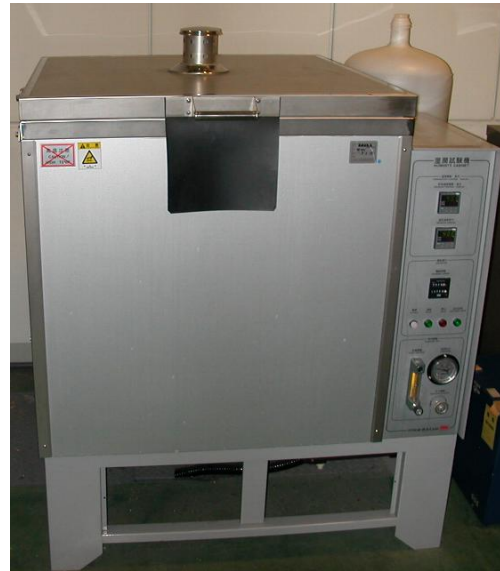
図 1 湿潤試験装置の外観

この試験は、室温よりも高めの一定温度で、湿度がほぼ 100%RH（95%RH 以上）の環境下で行う腐食試験です。試験片への風の当たり方が腐食速度に影響します。このため、湿潤試験装置は、試験片を一定速度で回転できる構造をしています。当所の湿潤試験装置の外観を図 1 に示します。