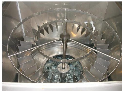
図 2 湿潤試験装置の内部

本装置は、JIS K 2246（さび止め油）や JIS K 5600（塗料一般試験方法）で規定されている試験に対応しています。また、塗膜に限らず、アルミニウム材のくもりや各種めっきの評価でも使用されています。